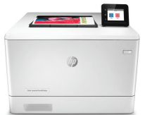
HP Color LaserJet Pro M454dw彩色激光打印机