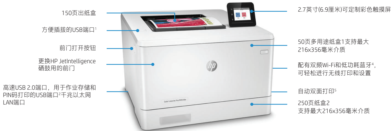
HP Color LaserJet Pro M454dw 彩色激光打印机