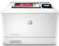
HP Color LaserJet Pro M454dn彩色激光打印机