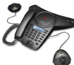
Mid 2 Ex