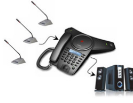
Mid 2 HC