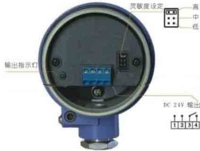
图 2. 振动棒料位开关接线示意图